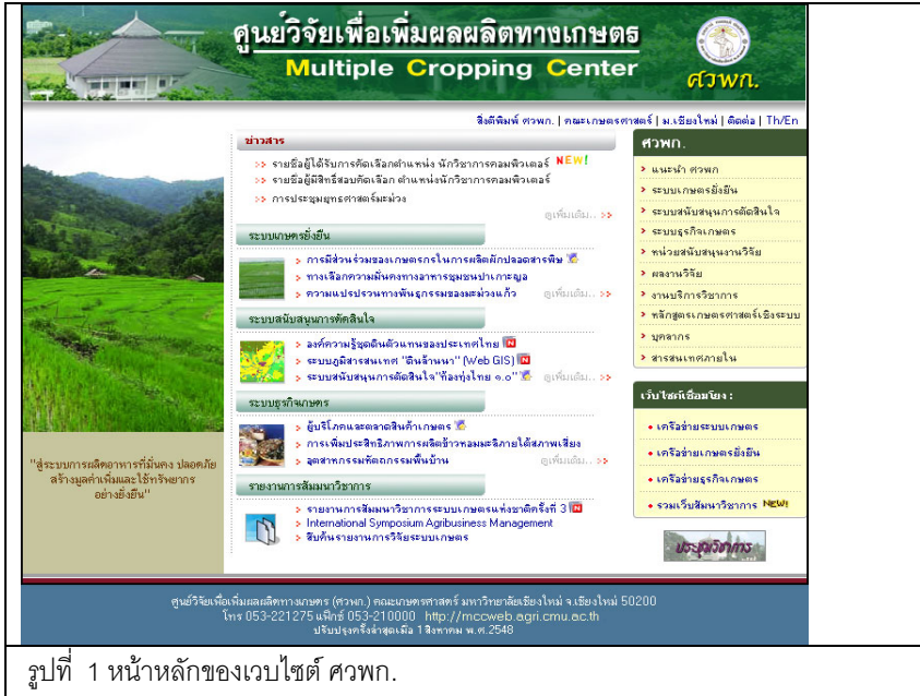
รูปที่ 1 หน้าหลักของเว็บไซต์ ศวพ.

เว็บไซต์ที่ได้รับการปรับปรุงมี 3 ส่วนหลัก ส่วนแรกคือส่วนของหน้าหลักของเว็บไซต์ ได้ออกแบบโครงสร้างฐานข้อมูลของเนื้อหาที่จะนำเสนอบนหน้าเว็บเพจ และกำหนดตำแหน่งการจัดวางข้อมูลที่ต้องการให้เป็นที่ตั้งใจดูดี และเชื่อมโยงกับรายละเอียดของเนื้อหาในหน้าถัดไปได้ดีขึ้น ทำให้หน้าเว็บบ่อยตา ประกอบไปด้วยเนื้อหาที่น่าสนใจ และส่วนอำนวยความสะดวก ไม่ว่าจะเป็นหัวข้อสำคัญของแต่ละหน่วยวิจัย รายงานการสัมมนาวิชาการ พร้อมทั้งข่าวประกาศที่เป็นปัจจุบันและสามารถเรียกดูย้อนหลังได้ (รูปที่ 1)