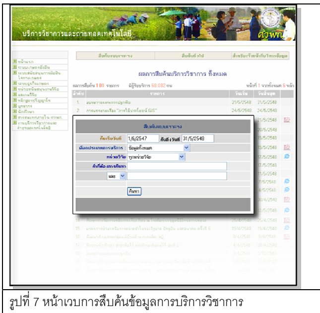
รูปที่ 7 หน้าเว็บการสืบค้นข้อมูลการบริการวิชาการ

นอกจากนี้ยังได้จัดทำระบบสืบค้นงานบริการวิชาการให้สามารถสืบค้นข้อมูลผลงานบริการวิชาการของ ศว. งานฝึกอบรมและงานเผยแพร่ความรู้แก่ชุมชน (รูปที่ 7) เพื่อสนับสนุนงานประกันคุณภาพการศึกษา ทำให้การรวบรวมผลลัพธ์จากงานบริการวิชาการถูกต้องยิ่งขึ้น