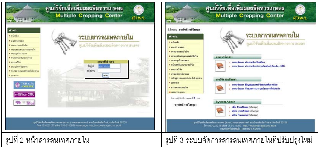
รูปที่ 2 หน้าสารสนเทศภายใน